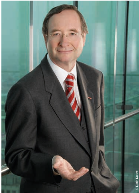
Dr. Christoph Leitl Präsident der Wirtschaftskammer Österreich